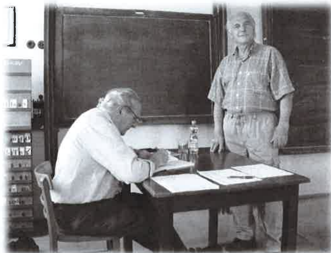
Autogramiáda s Milošem Konečným

Knihovna je umístěna v budově bývalé školy Vlkov č. 7 v prvním poschodí. Je otevřena každý čtvrtek od 15.30 - 18.30 hodin. Po dohodě je možné knihovnu navštívit i mimo otevírací dobu. Pro starší občany nabízím donášku knih.