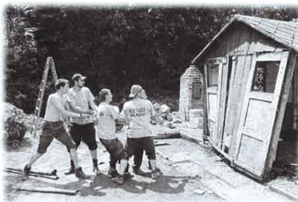
Pomoc v Rudníku

Dětský den, který se letos konal 8. června, byl na jedničku s hvězdičkou. Počasí se na odpoledne konečně umoudřilo. Hasiči nejen dětem připravili přehlídku stavebních strojů. Dále