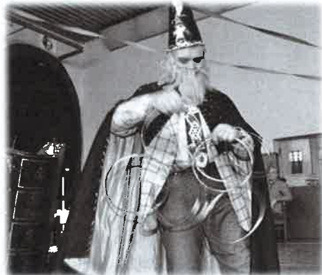
Na karneval přišel i kouzelník