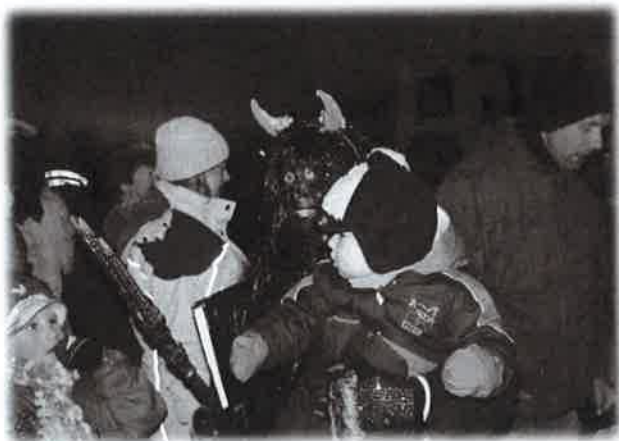
Opravdu čertovská nadílka

ročníku drakiády. Tato akce byla opětovně poznamenána nepřízní počasí. Takže jsme pouze opékali brambory v popelu. I tak se akce nakonec vydařila. Na 7. prosince jsme zorganizovali příchod Mikuláše. Ráno jsme ozdobili vánoční strom a odpoledne jsme připravovali vše potřebné na večer. Mikuláš s čerty a andělem dorazil kolem 17. hodiny. Při této příležitosti obdaroval děti balíčky, které jim věnovala obec. Poté Mikuláš rozsvítil vánoční strom a společně s dětmi se v lampiónovém průvodu přesunul na hřiště, kde jsme akci zakončili nádherným ohňostrojem s hudebním doprovodem.