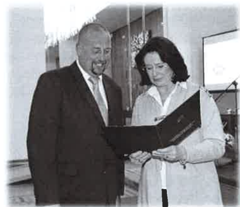
Slavnostní předání dekretu

Podařilo se nám pokračovat v pořádání cestopisných přednášek, uspořádali jsme obecní ples a již tradiční jarmark. Bohužel ne ve všech případech nám přálo počasí. Snažíme se podporovat i spolky, které vykonávají činnost v naší obci. Do mateřského centra byly zakoupeny dětské plastové židličky a stolky, při dětském dnu obec finančně zabezpečila skákací hrad a pěnu a konečně v červenci jsme ve spolupráci s T. J. Sokol Vlkov pomohli uskutečnit již tradiční pouťové posezení.