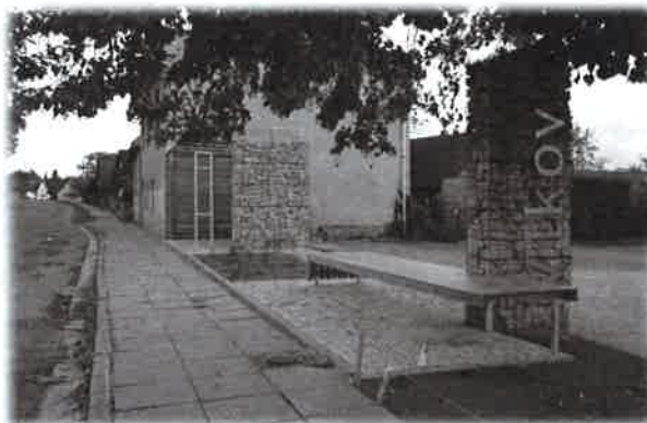
Nová autobusová zastávka

Loňský rok byl ve znamení příprav a realizací několika dlouho plánovaných akcí. Úspěšně jsme zakončili rekonstrukci autobusové zastávky a troufám si říci, že dopadla úspěšně a plně zapadá do vzhledu naší obce. Drobné nedodělky budou dokončeny v tomto roce. Dále v jarních měsících letošního roku dojde k výstavbě chodníku u nové zástavby podél silnice v Rasoškách, směrem na Nový Ples, neboť snaha o zvýšení bezpečnosti našich občanů skončila vydáním stavebního povolení.