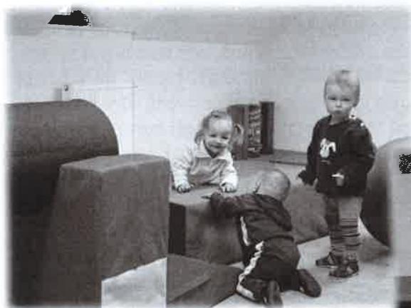
Berušky v akci