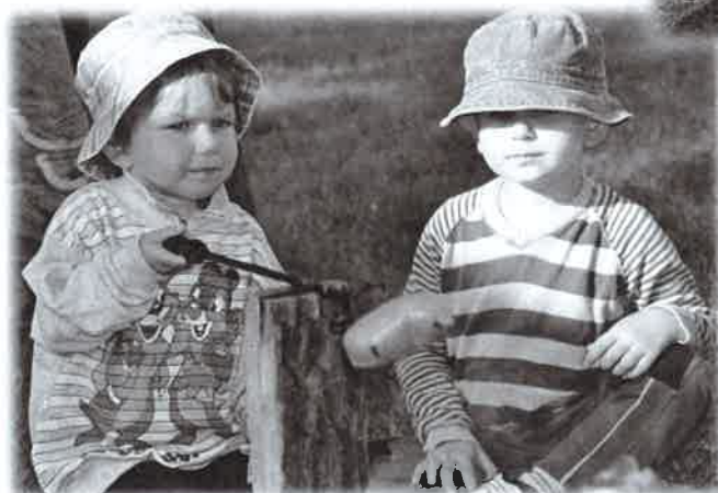
Táborák na závěr cvičebního roku

Na konec cvičebního roku jsme uspořádali táborák pro členy i naše příznivce.