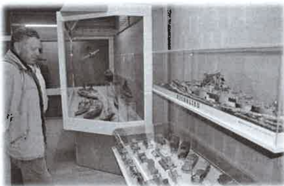
Muzeum papíru v Polici nad Metují

Prohlédli jsme si muzeum Merkur, Muzeum papíru a někteří se vydali z Police pěšky na Hvězdu, ti méně zdatní vyjeli auty. S country kapelou a sokoly z dalších jednot naší župy jsme tam při opékání vuřtů strávili příjemné slunečné odpoledne.