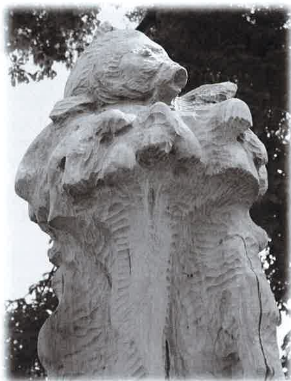
Kapřík na návsi