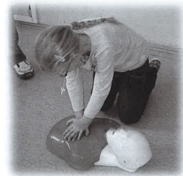
Kurz první pomoci

Přeji Vám klidný rok 2014, prožitý v pevném zdraví a pohodě.