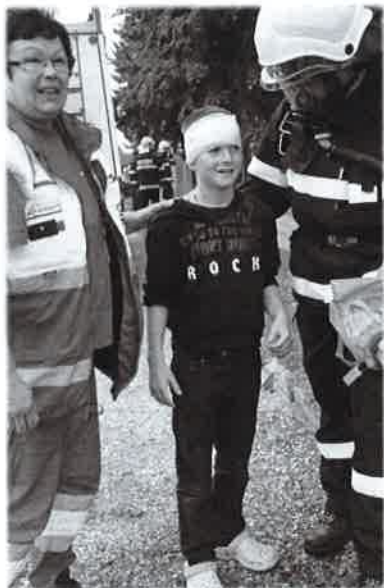
Cvičení integrovaného záchranného systému