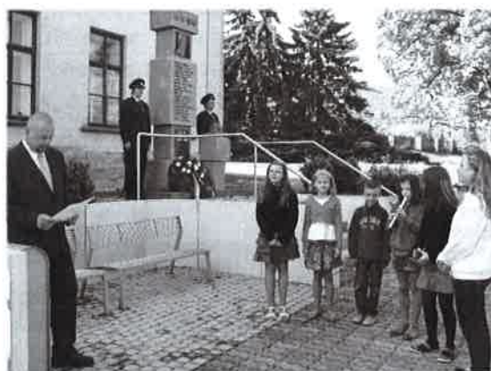
Pietní akt u pomníku padlých