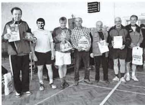
Velikonoční turnaj ve stolním tenisu

Kromě návěku na jubilejní všesokolský slet ale neustaly další aktivity téměř dvou stovek členů naší tělocvičné jednoty. Kromě pravidelného cvičení se staráme také o rozvoj spolkového života v obci.