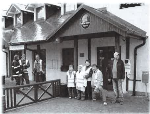
Nástup na úklid obce