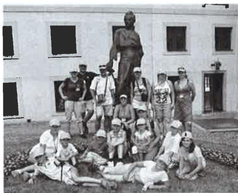
U sochy dr. M. Tyrše v Praze

na Malé Straně. Ve čtvrtek večer jsme všechny děti auty převezli ke stadionu, aby mohly na vlastní oči zhlédnout I. program hromadných vystoupení, který začínal ve 21 hod. za opravdu hrozivě bouřky a průtrže mračen. Byli jsme rádi, že jsme při večerním programu nevystupovali, protože ostatní cvičenci byli promočení až na kůži... Mnozí ale po sletu říkali, že právě cvičení v dešti bylo tím největším emočním zážitkem. V pátek 6. července odpoledne se při hlavním sletovém vystoupení představili i Vlkovští - na sluncem prozářené ploše nejmodernějšího stadionu v republice, kterou sledovalo na 20 000 diváků. My, co jsme necvičili, ale dělali dětem doprovod, jsme drželi palečky, aby se cvičení povedlo.