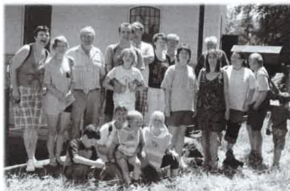
Výlet na kolech

Dětský den, který se konal 9. června, byl na jedničku s hvězdičkou. Počasí vyšlo. Nejen dětem připravili hasiči přehlídku historické i současné zemědělské techniky a hospodářských zvířat. Dále byla ro děti připravena spousta soutěží, po jejichž splnění dostaly balíčky s překvapením. Zajišťovali jsme i občerstvení. Na 23. června vyšel hasičský poznávací výlet na kolech. Byli jsme v jaroměřském Boučkově loutkovém divadle a také v Městském divadle, poté jsme se jeli podívat na elektrárnu a loděnici, kde jsme si i zapádlovali. Výlet jsme ukončili u hasičské zbrojnice ve Vlkově odpolední svačinkou. Týden na to, tedy 30. června, se konala již tradiční Vlkovská ulička. K tomu jsme zajišťovali posezení pod lipami. Přípravy probíhaly od brzkého rána. Zajišťovali jsme i občerstvení, aby se soutěžící mohli řádně před výkonem posilnit. Naše družstvo se umístilo na 3. místě.