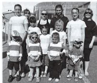
Slet Dvůr Králové nad Labem

Někteří z nás se účastnili jako diváci také vystoupení přehlídky Sokol Gala v Tesla aréně, prohlédli jsme si i Tyršův dům- sídlo Sokola