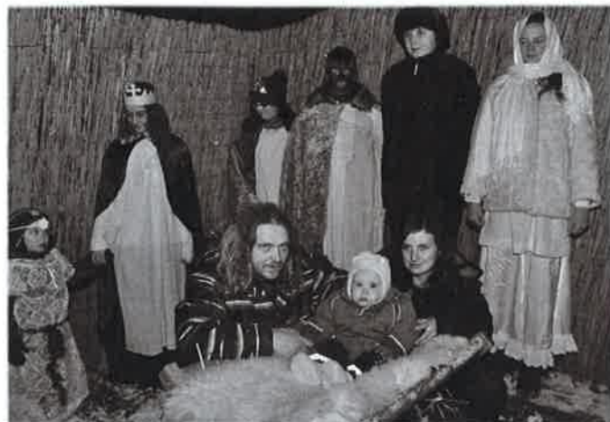
Putování k Betlému

Ještě jednou děkujeme všem členům vlkovského Sokola i jeho příznivcům za nezištnou pomoc při organizování výše uvedených akcí, roznášení plakátů, úklidu, dopravě na sportovní akce, organizování každodenního cvičení. Bez jejich přičinění by naše činnost v tomto rozsahu nebyla možná. Děkujeme i za jakékoliv dary do plesových tombol, které významně napomáhají ziskovosti pořádaných plesů. Pro hospodaření naší jednoty jsou velice důležité výtěžky z těchto kulturních akcí pro veřejnost. Zveme vás proto na ně i v nadcházející sezóně. Díky tomu pak můžeme během roku pořádat další nevýdělečné podniky pro děti i dospělé.