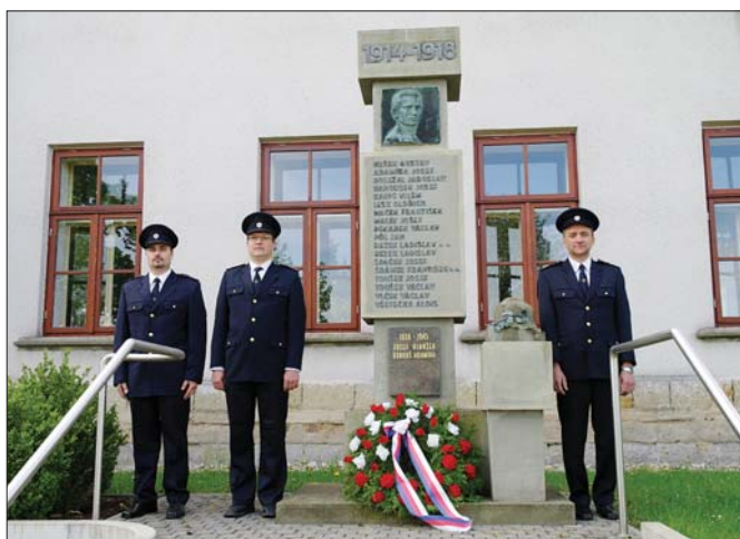
Pietní akt u pomníku padlým 8. května