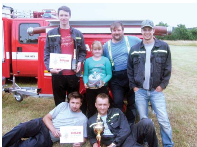
Vítězné družstvo hasičské soutěže v Rasoškách 27. června