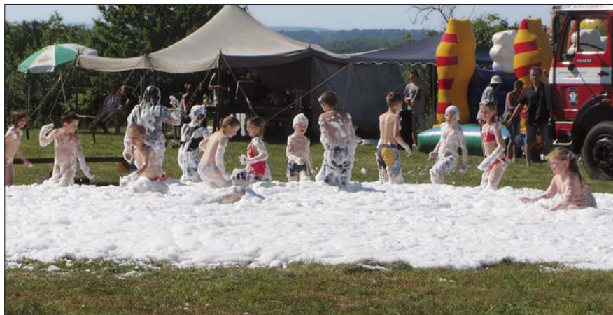
Tradiční zakončení dětského dne v pěně

Dětský den, který jsme uspořádali 6. června, byl ve znamení hasičského tématu. Potěšila nás vysoká účast. Pro děti byla připravena řada her a jako tradičně byl zakončen kupou pěny, kterou nám vytvořili hasiči z Černožic. Za finanční podpory obce se nám podařilo pro děti zajistit i skákací hrad. 20. června se uskutečnil hasičský poznávací výlet na kolech. Navštívili jsme zrekonstruovaný Hospital Kuks, kdy nás neodradila ani nepřízeň počasí. Náš sportovní výkon jsme zakončili v hasičské zbrojnici opeče-