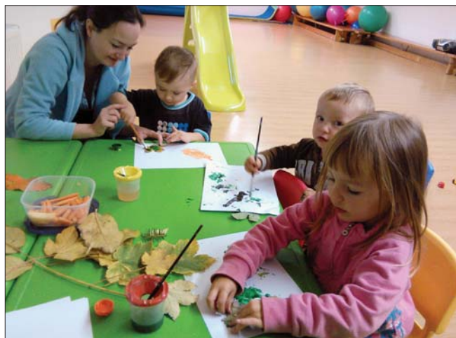
Děti tvoří v mateřském klubu Beruška

Milé maminky a děti předškolkového věku, v loňském roce, stejně jako v letech předešlých, jsme se scházeli, a stále scházíme každou středu, v podkroví Obecního úřadu ve Vlkově v čase od 9.30 do 11.30 hod. Děti se v úvodu našeho setkání vyřádí na prolézačkové dráze nebo vyzkoušejí svou hbitost na superrychlé skluzavce. Společně tvoříme z modelíny, pomocí pastelek, razítek, fixek či foukacích fixek nebo toho, co právě příroda v daném ročním období nabízí. Děti se ke konci našeho setkání těší na básničky a písničky provázené pohybovými aktivitami. Na jaře a na podzim jsme společně navštívili zábavný park Tongo, koncem roku jsme podnikli výlet vlakem do hradeckého Budulínku. V případě, že je teplé slunné počasí, opouštíme vlkovské podkroví a scházíme se venku nebo třeba na dětském hřišti v Libřicích.