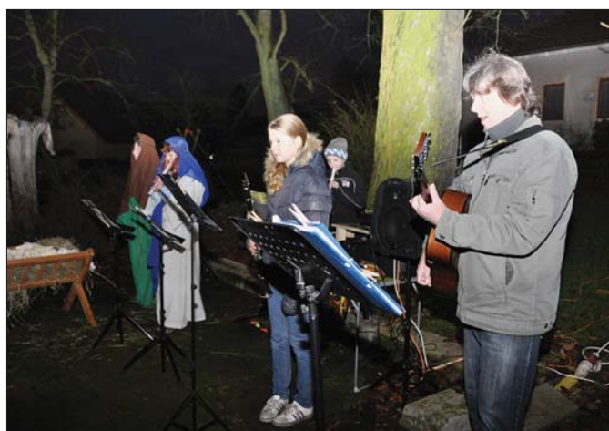
Putování k Betlému