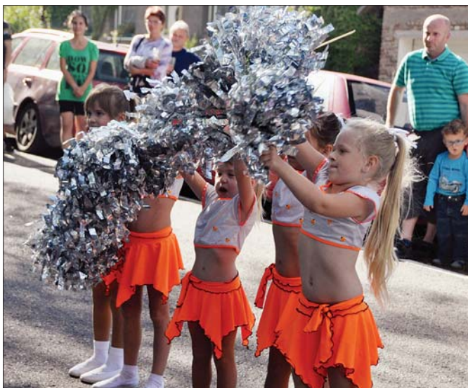
Vlkovský jarmark 19. září 2015