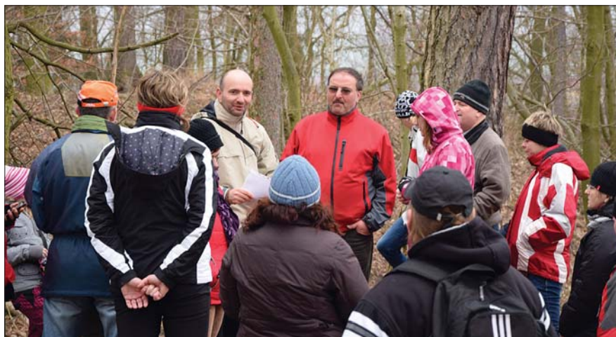
Na místě zaniklého hrádku nad Dubencem

Na tři desítky zájemců o historii se tak seznámily s lokalitou na Chloumku u Habřiny, tvrzištěm v Habřině, zaniklým hrádkem nad Dubencem či obléhacím táborem ve Velkém Vřešťově.