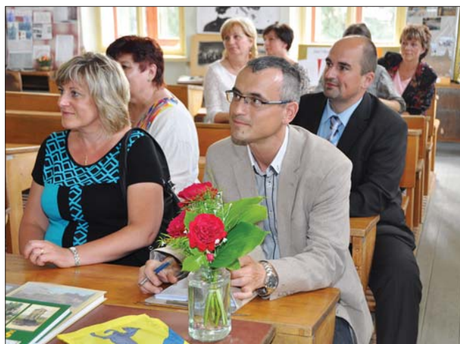
Z návštěvy hodnotitelské komise soutěže Vesnice roku ve Vlkově