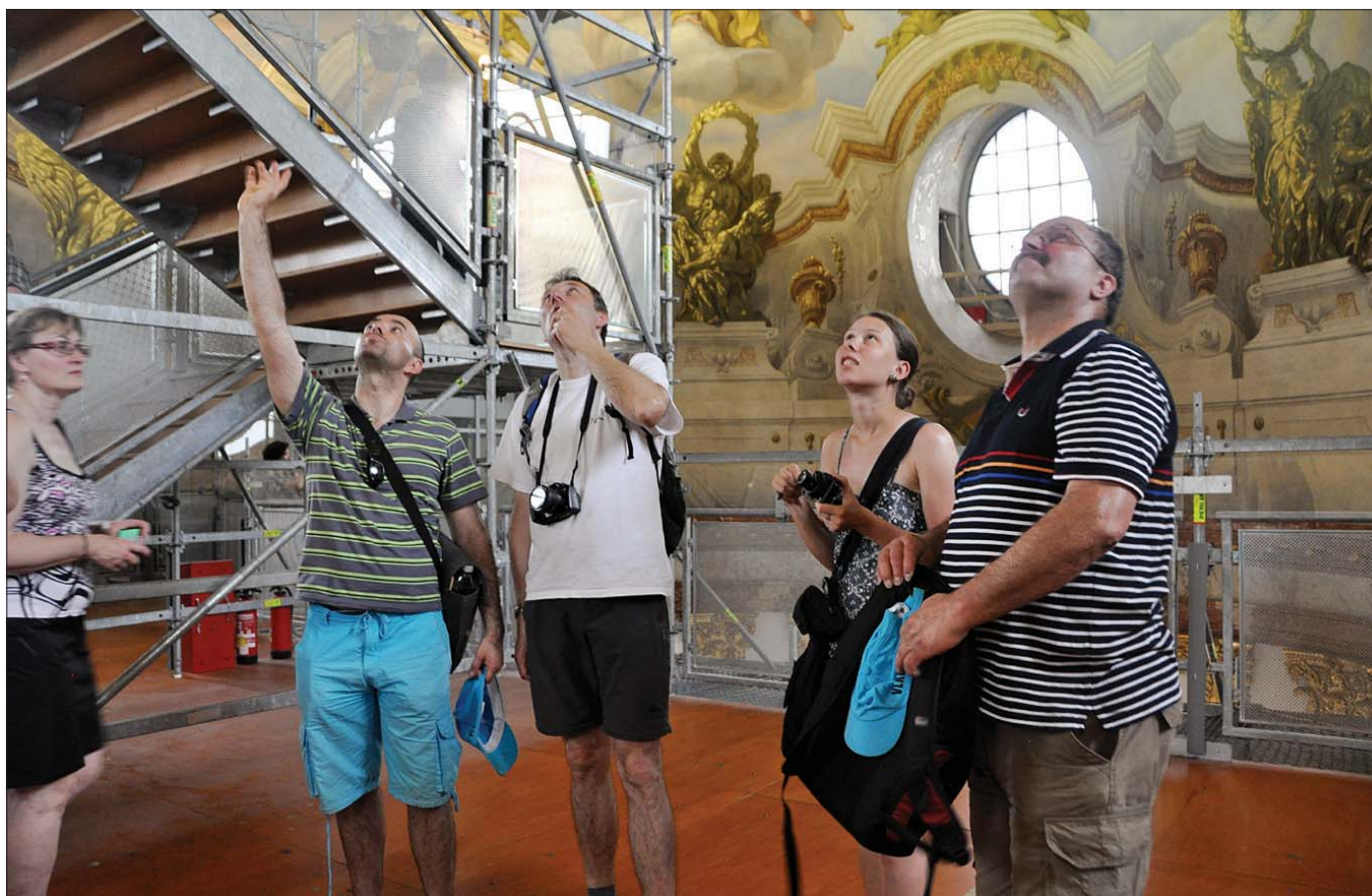
V kopuli kostela sv. Karla Boromejského s freskami na dosah ruky