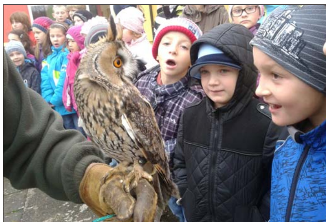
Ukázka výcviku dravců