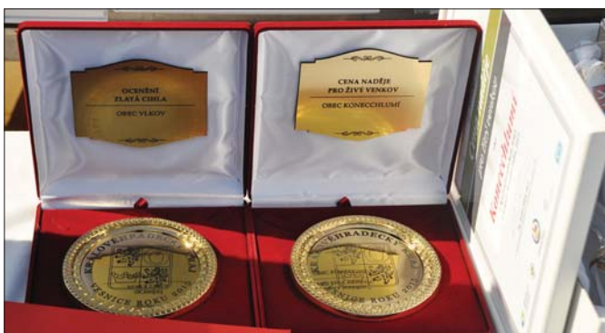
Ocenění Zlatá cihla v soutěži Vesnice roku