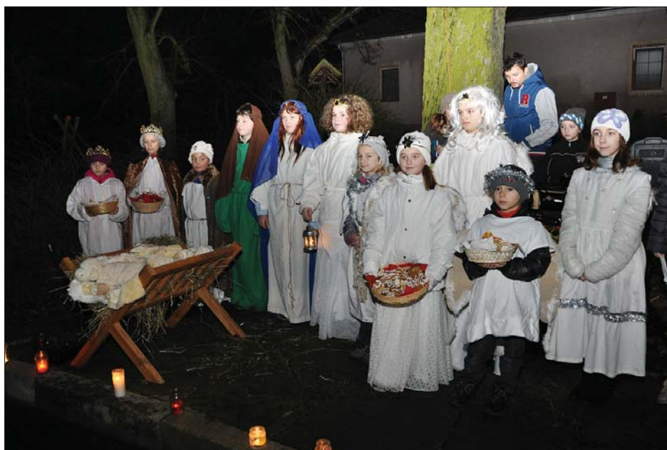
Putování k Betlému

Děkujeme i za jakékoliv dary do plesových tombol, které významně napomáhají ziskovosti pořádaných plesů, která bohužel v posledních letech klesá. Pro hospodaření naší jednoty jsou velice důležité výtěžky právě z těchto kulturních akcí pro veřejnost. Zveme vás proto na ně i v nadcházející sezoně. Díky tomu pak můžeme během roku pořádat další nevýdělečné podniky pro děti i dospělé.