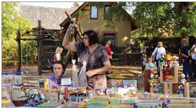
Vlkovský jarmark 19. září 2015