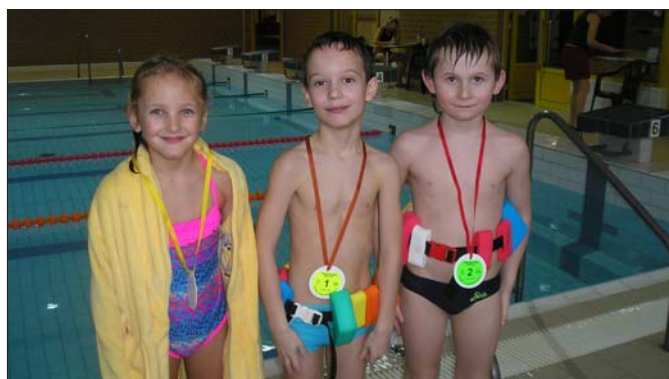
Plavecký výcvik v Náchodě