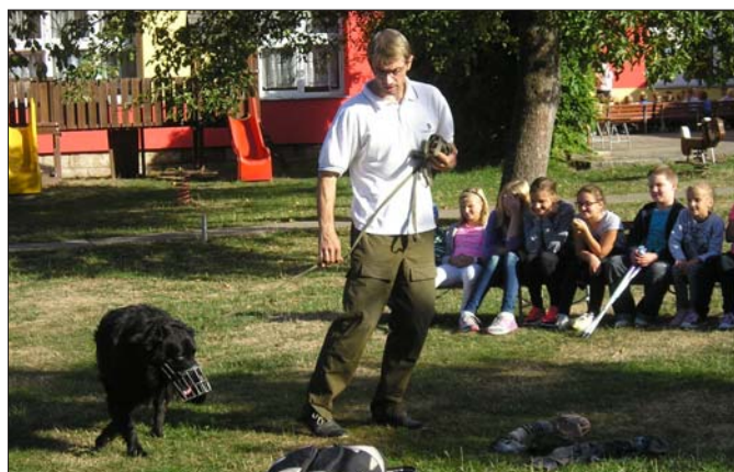
Výcvik asistenčního psa