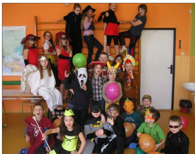
Halloween ve škole