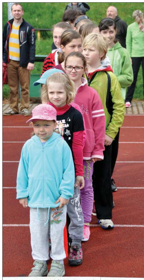
Na přeboru župy v atletice v Jaroměři

Kromě sálu sokolovny využíváme i malého sálu v podkroví obecního úřadu, kde se schází Sokolem založený rodičovský klub