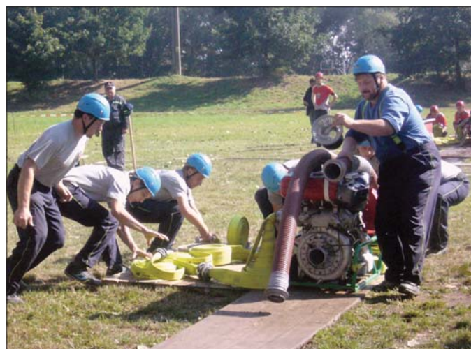
Na závodech v Černožicích 19. září