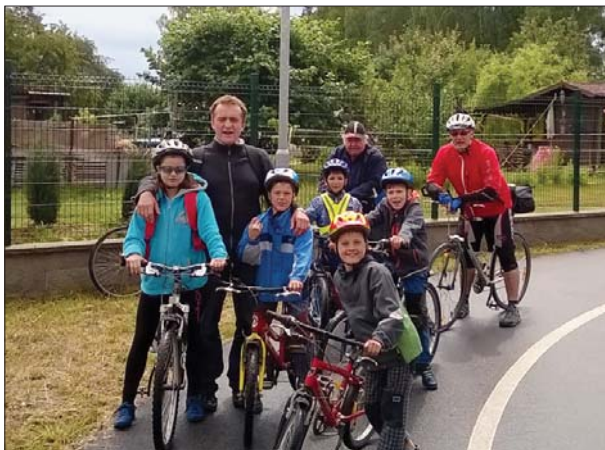
Cyklistický výlet do Kuksu 20. 6. 2015

drobné technické problémy na vozidle se výlet vydařil. Cestou jsme se podívali na trhy v Pecce. Poté jsme pokračovali do Dětenic, kde jsme po prohlídce zámku a Pekla zavítali do středověké krčmy, kde probíhal historický večerní program.