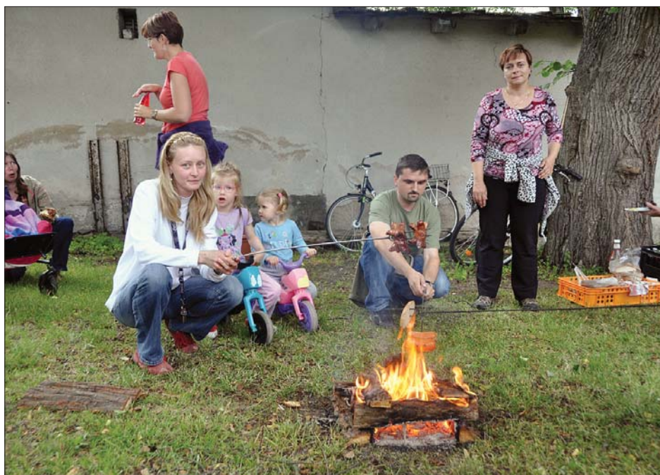
Opékání vuřtů na závěr cvičebního roku

Sokolské ženy v prosinci společně pekly perníčky a perníkové stromečky, připravily