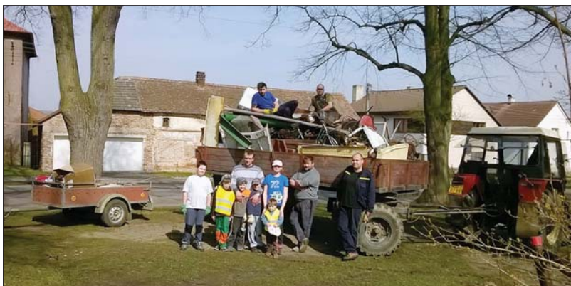
Sběr železného šrotu v obci

Jako již každoročně jsme se zástupci obce, sokola a Vámi občany položili věnec u pomníku padlých. Slavnostní akt byl doplněn vystoupením dětí z MŠ a ZŠ Rasošky.