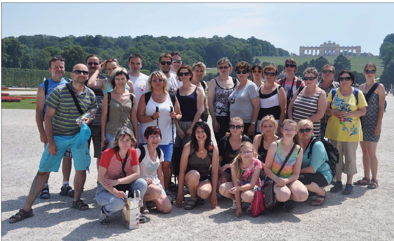
V zahradách zámku Schönbrunn