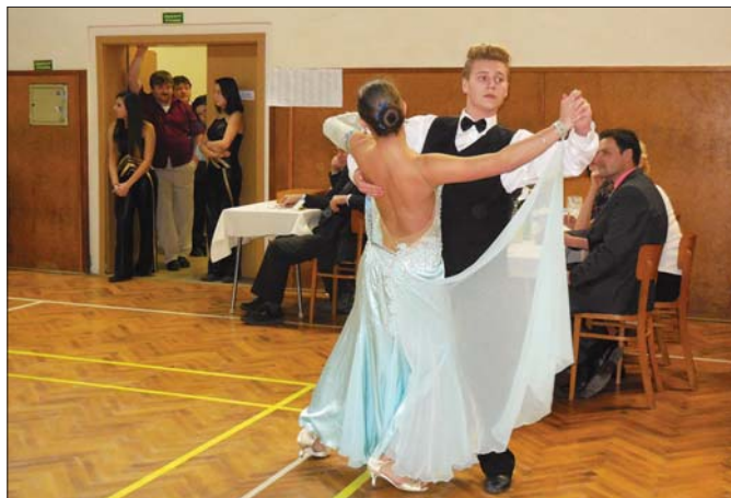
17. ledna se konal v místní sokolovně Obecní ples