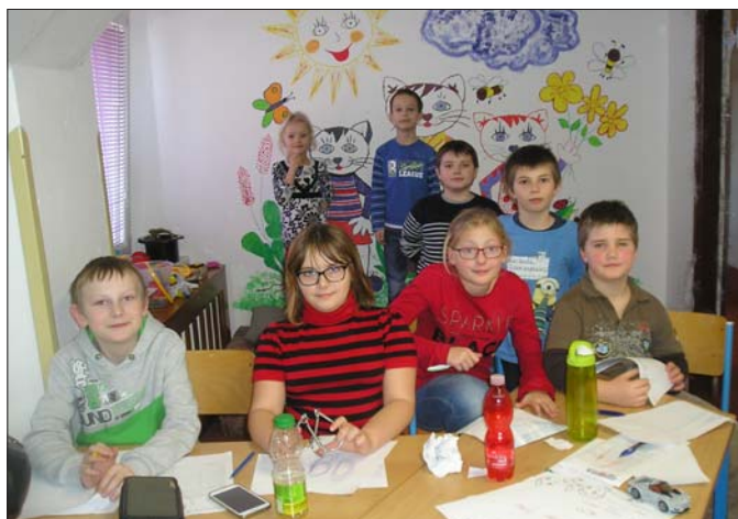
„Hledá se talent“ ve školní družině