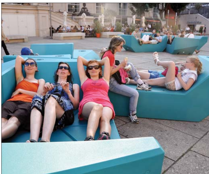
Odpočinek na nádvoří MuseumsQuartier