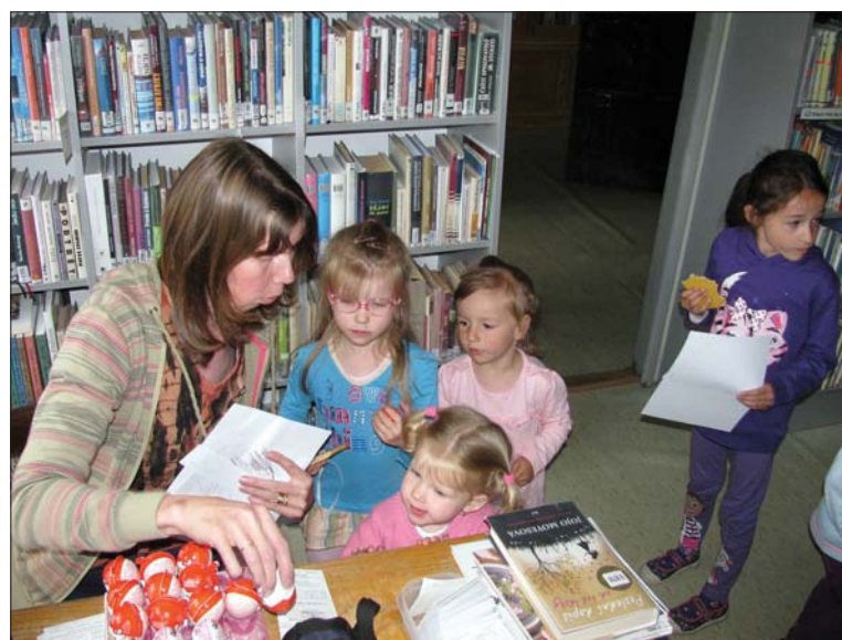
Děti jsou od malička ve vlkovské knihovně jako doma