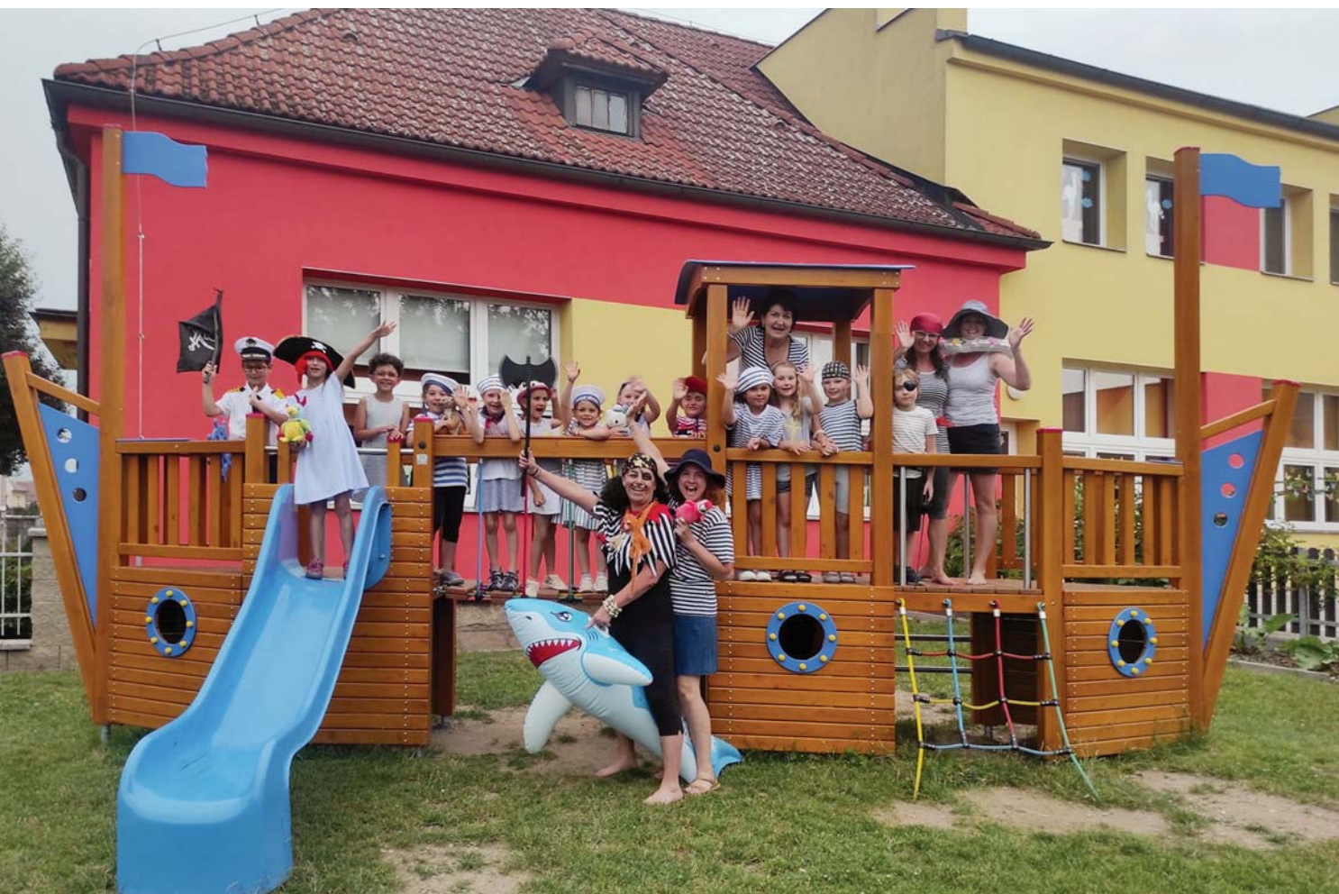
Malí námořníci na nové lodi.

Děti z mateřské školy měly možnost navštívit Divadlo Drak v Hradci Králové, kde si užily pohádky Do