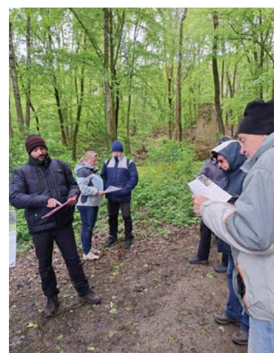
Procházka po Čěšovských valech.