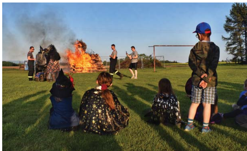
Pálení čarodějnic na hřišti.