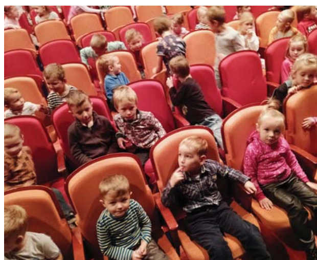
Výlet mateřské školy do Divadla Drak.

Nezapomenutelným zážitkem byla ukázka tlumočení do znakového jazyka pro neslyšící, za kterou děkujeme