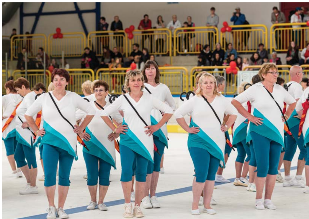
Župní slet ve Dvoře Králové nad Labem.

„Nácvik byl především kvůli k pracovnímu vytížení nás všech,