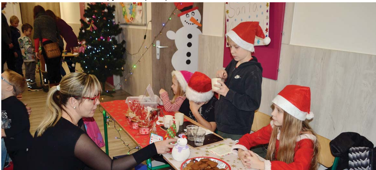
Vánoční jarmark letos v režii školních dětí.

jsme si zařadili jako čarodějnice a opekli si buřty, oslavili jsme svátek maminek zahradní slavností a zorganizovali jsme sportovní odpoledne pro tatínky.