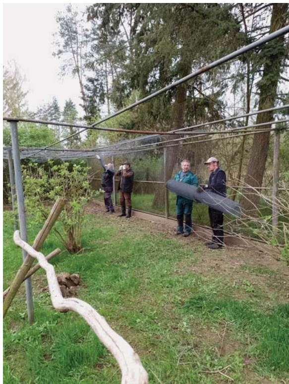
Společná brigáda v odchovně v Šutrách. Členové vyměňují staré nevyhovující pletivo za nové.