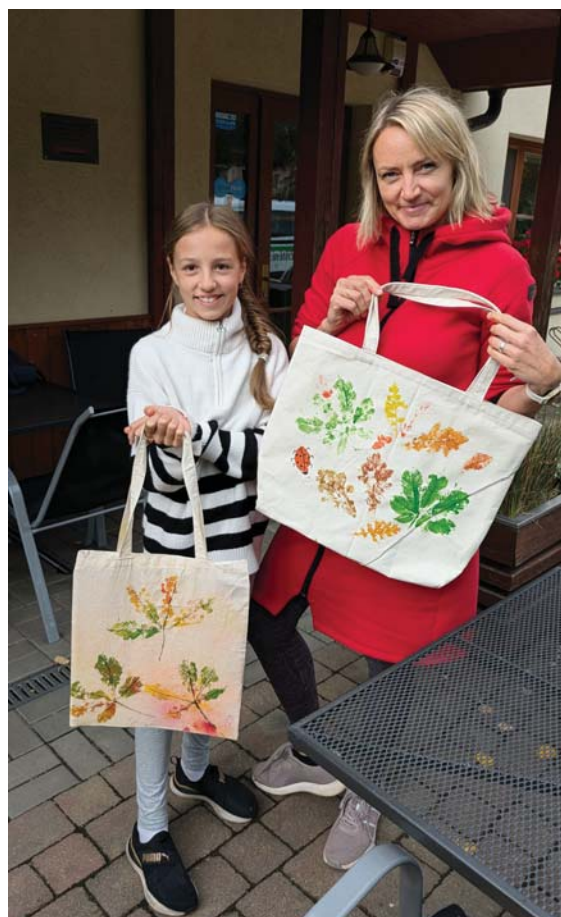
Potisk tašek přírodními motivy.