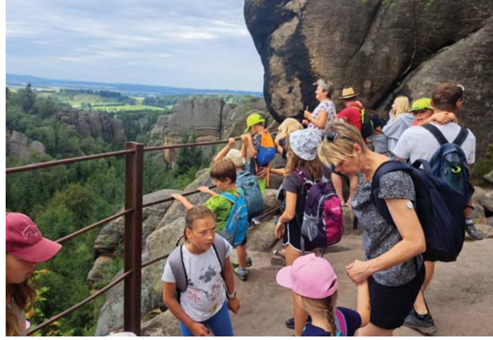
Nad Kovářovou roklí.