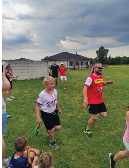
Olympijský běh s rodiči.

Nedílnou součástí života školy jsou oslavy různých svátků. Proto