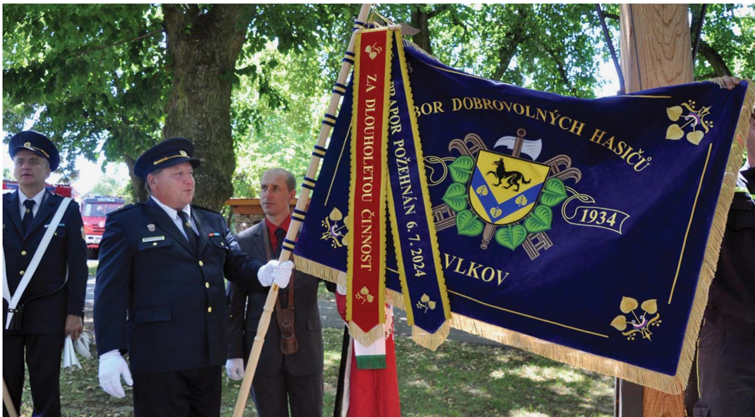
Nový prapor hasičského sboru.

Bezesporu hlavní událostí loňska byly oslavy 90 let od vzniku hasičského sboru. Výročí se stalo příležitostí k uspořádání veřejné akce, jakou co do rozsahu a pojetí Vlkov již řadu let nezažil. Vrátili jsme se při ní ke zvyku slavnostních průvodů vesnicí s vlajkoslávou, k veřejnému udílení poct, k setkání se sousedy a přáteli z početných okolních obcí a k všeobecné zábavě pod širým nebem, kterou otevřel promenádní koncert a jíž završila večerní taneční hudba. Vrcholem slavnosti bylo představení nového praporu hasičského sboru, který po obecní vlajce a praporu sokolském dotvořil trojlístek symbolů, jimiž se v naší vesnici můžeme při výjimečných okamžicích pyšnit a k nimž se můžeme hlásit.