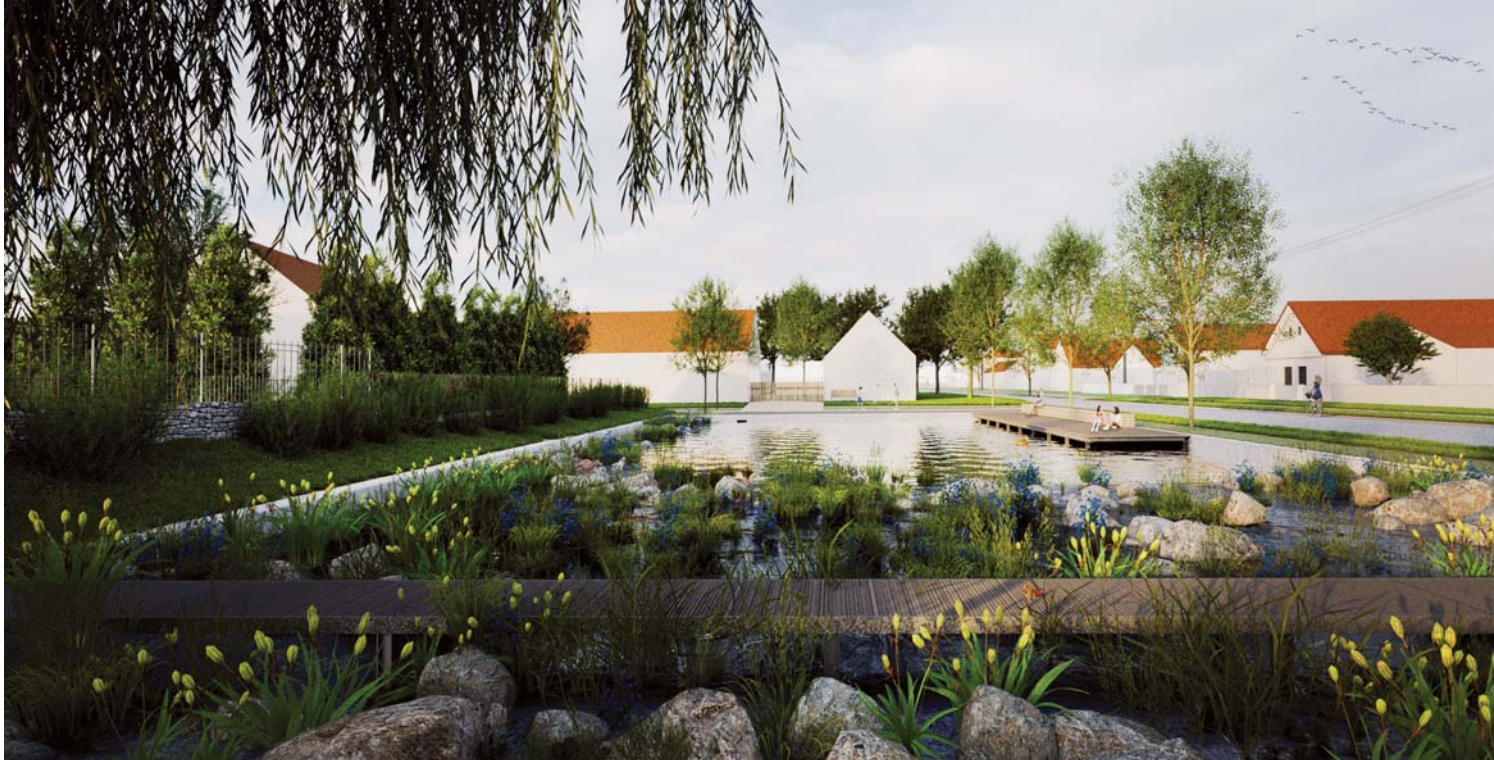
Vizualizace nové podoby rybníku na návsi.

Pokud Vás zajímají další zprávy z obce, naleznete je ve veřejných zápisech z jednání zastupitelstva. O sobě samých se pak dočtete na následujících stránkách, jejichž obsahová pestrost, kterou sami spoluutváříte, je dlouhodobě naší výbornou vizitkou.