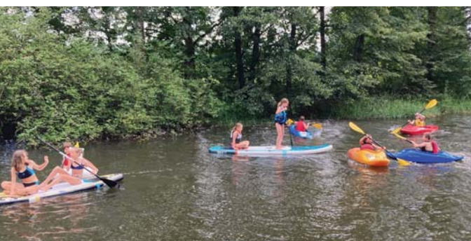
Na řece Úpě.