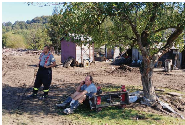
Vlkovští hasiči pomáhali v České Vsi.