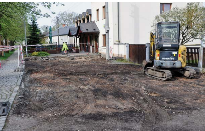
Zahájení stavebních prací před obecním úřadem v dubnu 2024.