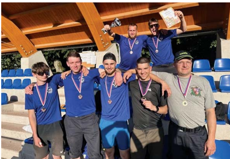
Okresní kolo požárního sportu v Náchodě.

Začaly prázdniny a přišel 6. červenec, datum naší domácí soutěže Vlkovská ulička, letos spojené s oslavami 90. výročí založení SDH Vlkov. Pro nás to byl velmi důležitý a dlouho očekávaný den, kterému předcházela tvrdá práce a poměrná míra nervozity. Od rána bylo hezké počasí, takže soutěž proběhla v klidu a bez úrazů. Proběhl i exhibiční útok s naší válečnou stříkačkou a starou gardou. Vítězem Vlkovské uličky se stalo družstvo SDH VLKOV „A“.