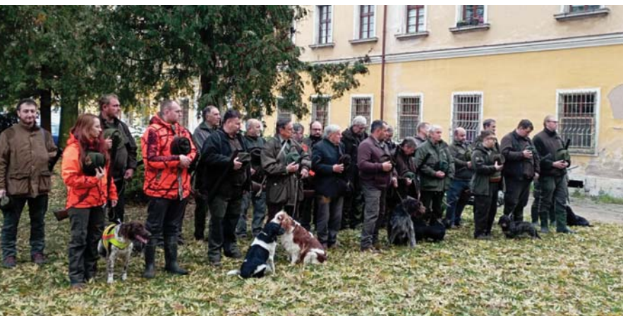
Nástup zúčastněných před honem. Účastníci se seznamují s programem a bezpečnostními pravidly.

V minulém roce jsme pořádali již 2. ročník mysliveckého dne v Rasoškách. Největším lákadlem byly zvěřinové speciality, zabavili jsme i děti odbornou přednáškou z myslivosti, zoologie a mysliveckých tradic. Byla podána velice hravou a zajímavou formou, která zaujala i mnohé rodiče. V odpoledních hodinách zahrál DJ Medy pro děti, později i pro dospělé. Akci bereme za zdařilou, což potvrzují i ohlasy občanů.