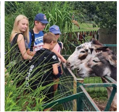
Farma Wenet u Broumova.