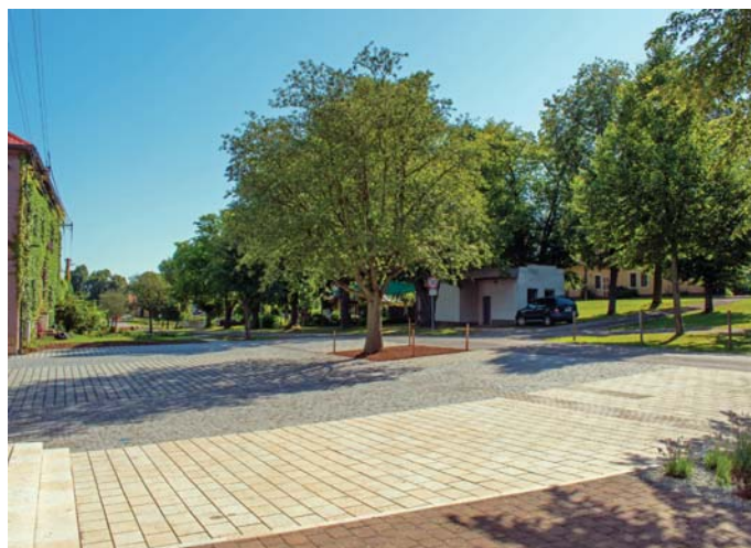
Dokončená rekonstrukce ploch v centru obce.

Povzbuzeni výsledkem proměny parkovací plochy, pracujeme na další významné akci. Známe jej všichni a považujeme jej za samozřejmost. A snad jej již ani podstatněji nevnímáme. Pouze jej míváme a občas se u něj sejdeme na hasičských závodech. Ale jinak? Co tam, co s ním? Ano, jedná se o vlkovský rybník na návsi, který v minulé době upadl do podoby pouhé technické nádrže. Voda v centru obce je obrovskou příležitostí, kterou nechceme nechávat ladem. Projekt, pocházející opět z pera tvůrců architektonické koncepce obce, sleduje za cíl všestrannou rehabilitaci a proměnu opomíjeného místa. Našimi hlavními zájmy jsou ekologie, estetika a nové funkce pro občany. Souhrnem připravených opatření a zásahů chceme probudit rybník jako jedno z přirozených center obce a učinit jej součástí veřejného prostoru, u kterého je radost pobýt. Držme si prosím palce, neboť žádáme o podporu tohoto projektu z dotačních zdrojů, které mohou pokrýt téměř veškeré tzv. uznatelné náklady.