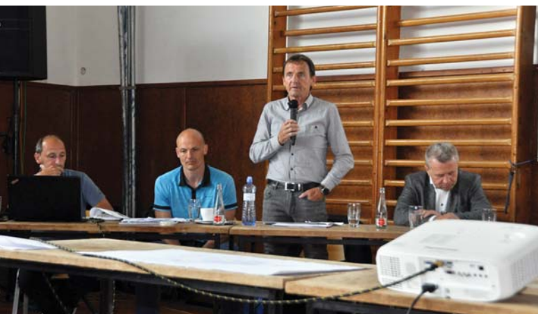
Firma Agrivolt Rasošky představuje záměr výstavby obří fotovoltaické elektrárny.