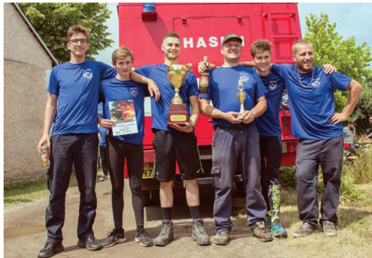
Vlkovská ulička – vítězné družstvo A domácích.

V srpnu se po pěti letech konal největší hasičský festival Pyrocar. Rozhodli jsme se vystavit tam náš technický klenot, a tak jsme připravili a nablýskali naši babičku Avii, aby vydržela dlouhou cestu do Přibyslavi, kde se akce konala na letišti. Naše vozidlo zdárně zvládlo cestu tam i zpět a moc se líbilo i přes fakt, že konkurence byla obrovská.