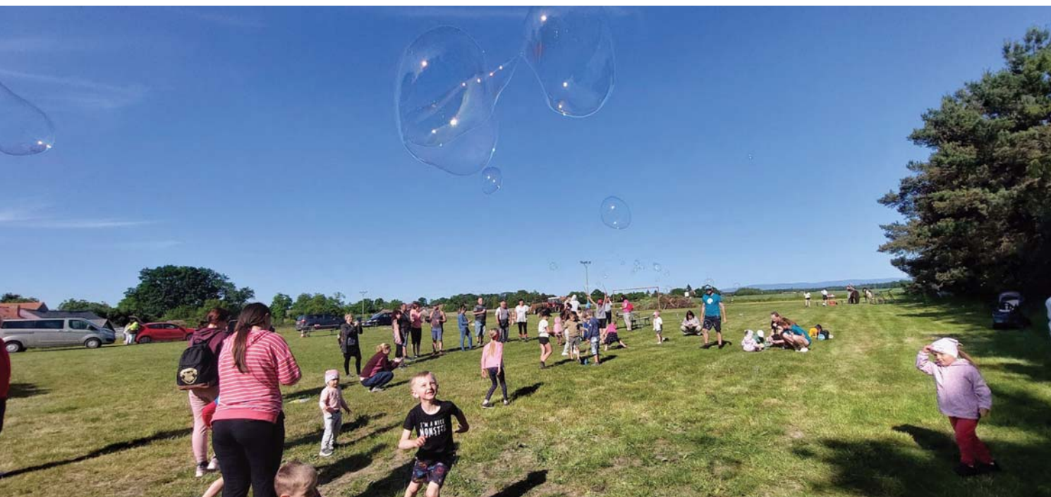
Dětský den na hřišti.

Květen započal aktivními plány na dětský den a také jsme odstartovali závodní sezonu v Josefově. Při pietní akci u školy jsme tradičně uctili památku padlých jako čestná stráž. První sobota v červnu patřila jako vždy pořádání dětského dne, tentokrát na téma „povolání“. Na tuto akci jsme zajistili vystoupení bublinové show a v letošním roce jsme uspořádali tombolu pro děti. Akci jako takovou hodnotíme jako úspěšnou a povedenou, avšak vzhledem k malé účasti jsme se rozhodli ji přesunout na jiný termín, o kterém vás budeme včas informovat formou letáčku do schránky nebo na webu obce Vlkov.