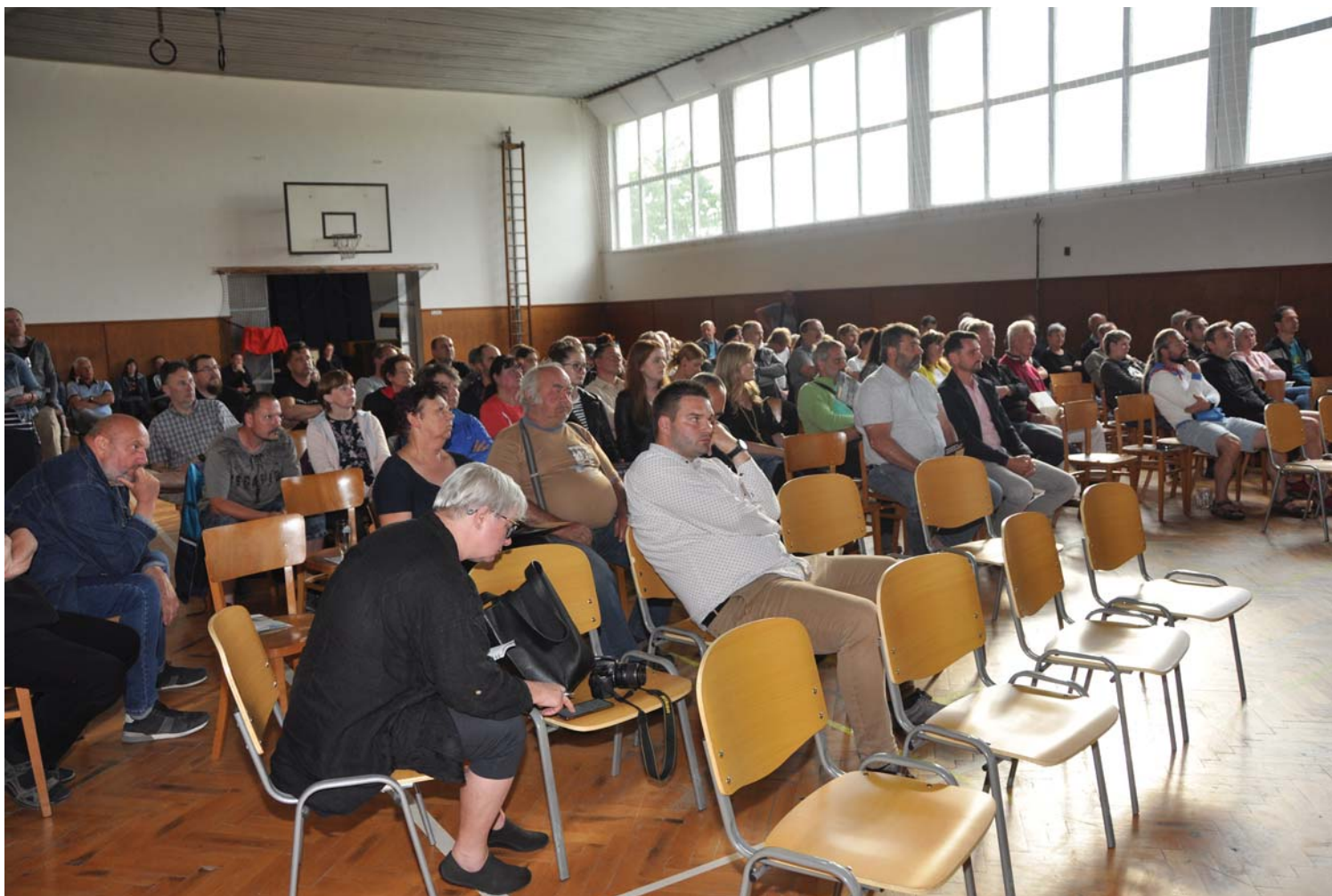
Zaplněná sokolovna – prezentace fotovoltaiky.

Z veřejných témat, o nichž se mezi Vlkováky hovořilo, se v uplynulém roce stala jednoznačně nejvýznamnější otázka projektu tzv. agrovoltaiky, který představila společnost Agrivolt Rasošky. Záměr vybudovat na katastrech Vlkova, sousedních Rasošek a Nového Plesu fotovoltaickou elektrárnu v rozsahu zcela se vymykajícím měřítku, na jaké jsme v naší obci zvyklí, vzbudil širokou odezvu. Mnozí z vás se zúčastnili červnového veřejného představení záměru a diskuse s jeho původci v sokolovně, řada z vás adresovala otázky zastupitelům a téma široce probírala v rozhovorech se sousedy a přáteli. Zastupitelstvo se jednoznačně shodlo, že podnikatelský projekt obří fotovoltaické elektrárny představuje mimořádný zásah do života a tváře naší vesnice, o kterém dosud nikdy nebylo veřejně uvažováno a který není součástí žádné oficiální rozvojové strategie Vlkova. Z toho důvodu jsme se usnesli, že v případě přijímání rozhodnutí v této záležitosti budeme vycházet z většinového názoru obyvatel.