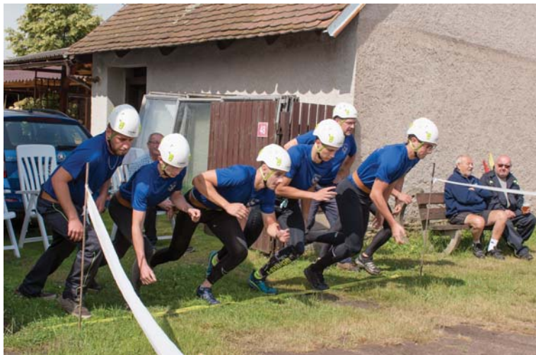
Vlkovská ulička – na startu.

Nastal červenec a hned první sobota patřila Vlkovské uličce, která se jako každý rok vydařila. Bohužel účasti sborů na závodech jsou čím dál menší. I toto je jeden z důvodů, který nás pohání a motivuje... Udržet tento krásný sport a hasičinu jako takovou.