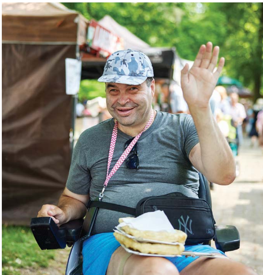
Benefice pro klienty Domova sv. Josefa jsou plné pozitivní energie.